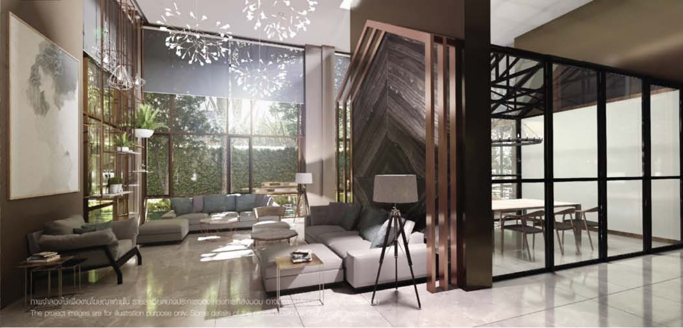
ภาพจำลองไว้เพื่องานโฆษณาเท่านั้น รายละเอียดบางประการของโครงการที่ส่งมอบ อาจมีการเปลี่ยนแปลงตามความเหมาะสม The project images are for illustration purpose only. Some details of the project could be changes as appropriate.