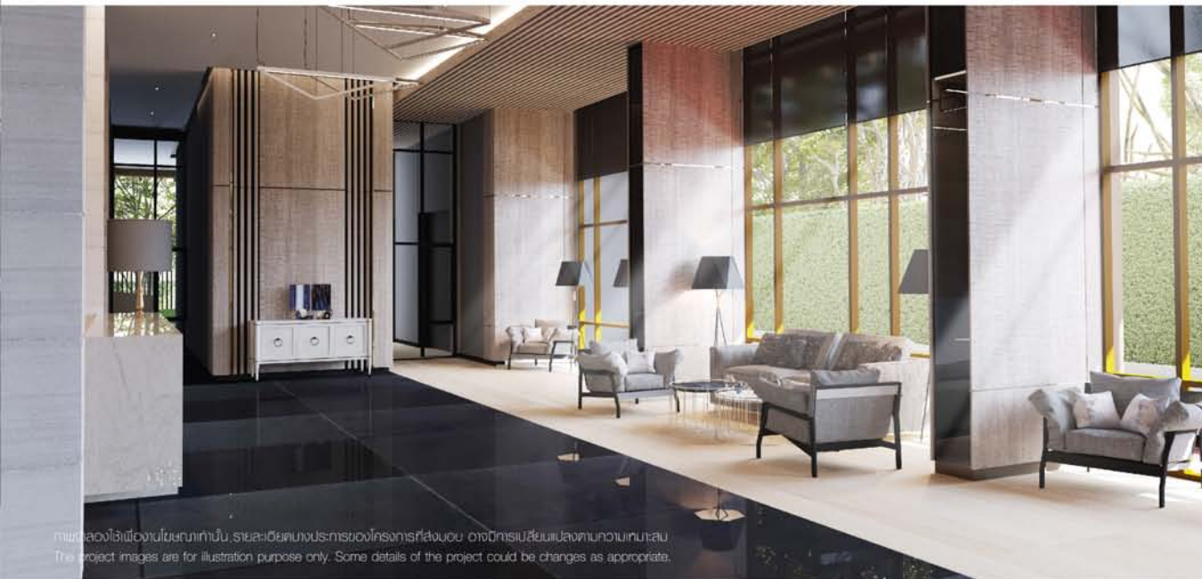
ภาพจำลองไว้เพื่องานโฆษณาเท่านั้น รายละเอียดบางประการของโครงการที่ส่งมอบ อาจมีการเปลี่ยนแปลงตามความเหมาะสม The project images are for illustration purpose only. Some details of the project could be changes as appropriate.