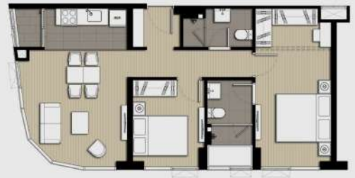
E1 2 BEDROOM 63 SQ.M.