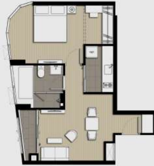
B3 1 BEDROOM 46 SQ.M.