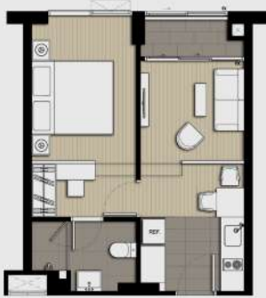
A1M 1 BEDROOM 34.00 SQ.M.