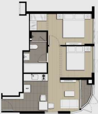
C1M 1 BEDROOM 47 SQ.M.