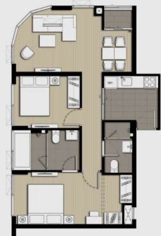
E2M 2 BEDROOM 64 SQ.M.