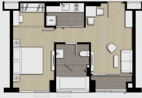
B1-1M 1 BEDROOM 44.5 SQ.M.