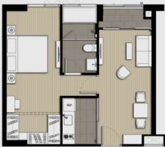
B2 1 BEDROOM 46 SQ.M.