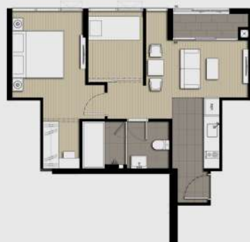
C3 1 BEDROOM 49 SQ.M.